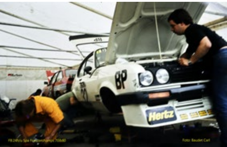
FB - 24h Spa - Francorchamps 1980