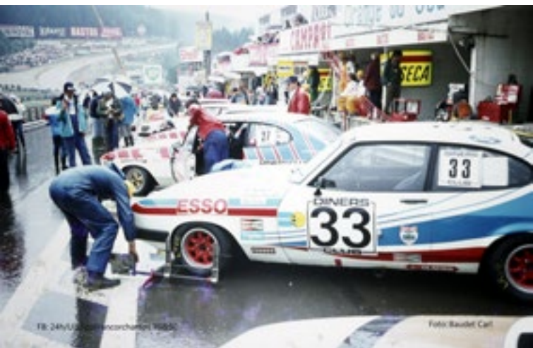
FB - 24h Spa - Francorchamps 1980