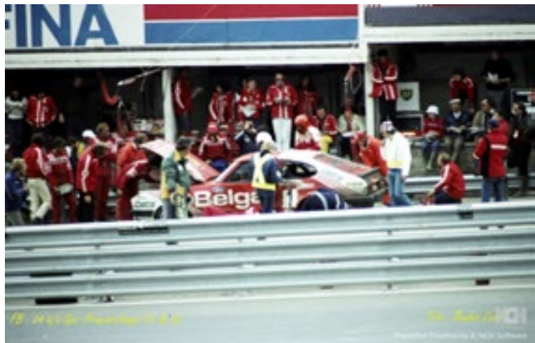
FB - 24h Spa - Francorchamps 1980