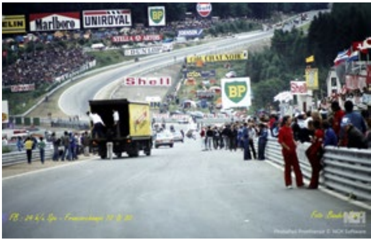
FB - 24h Spa - Francorchamps 1980