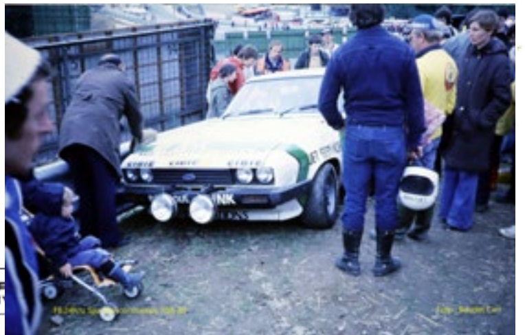
FB - 24h Spa - Francorchamps 1980