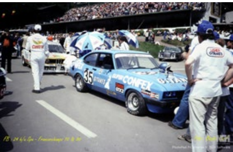
FB - 24h Spa - Francorchamps 1980

Published with permission of MCR Software