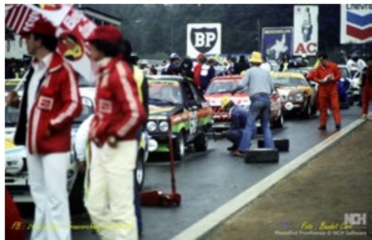
^Hier zie je mij in korte broek rondlopen in de pit.