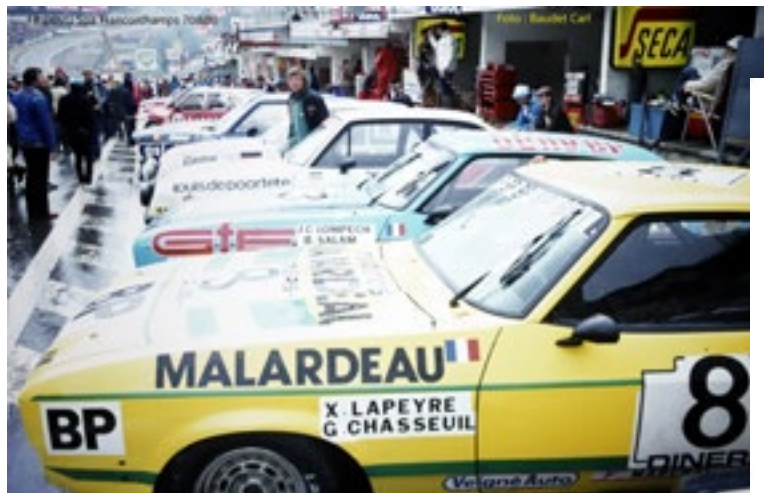
FB - 24h Spa - Francorchamps 1980